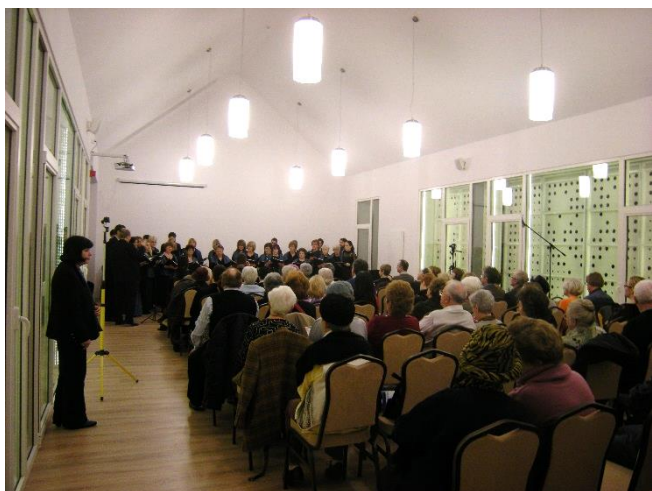
Az Adorate kórus adventi koncertje a plébánia emeleti nagytermében, 2014. dec. 20-án.

Koldulni azt jelenti: áldani azokat, akik feléd fordulnak, akiktől kapsz. De áldani azokat is, akik nem vesznek észre, nem figyelnek rád, elmennek melletted érzéketlenül. Sőt: koldulni azt jelenti, hogy megtanulhatod még azokat is áldani, akikben jelenléted borzongást, talán gyűlöletet vált ki.