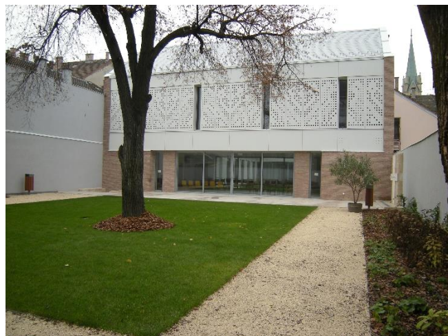
Az új plébánia hátsó kertje decemberben: most várja a jótékony havat...