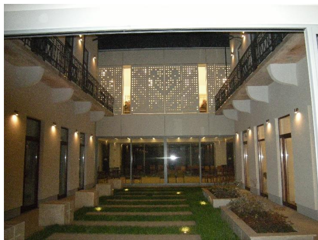
Az új plébánia első udvara, kerengője, esti szép kivilágításban.