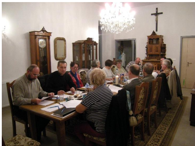
A régi összetételű egyháztanács utolsó ülése, már az új plébánia tanácstermében.

Így is, úgy is meghalunk. Haljunk meg Krisztusban az evilág számára és feltámadunk! Őbenne! Higgyünk az ígéretnek, az Örömhírnek és Szent Pálnak. Higgyünk az egy szent katolikus és apostoli anyaszentegyháznak, ami Krisztus teste! Legyünk benne tagok, bánjuk meg bűneinket, hagyjuk lerombolódnai bálványainkat és beköltözik szívünkbe az Isten. Ui.: zuhanó repülőgépen nincs ateista. Az evilági életük zuhanó repülőgép, még ha nem is gondolunk rá. - Egy laikus: K. GY.